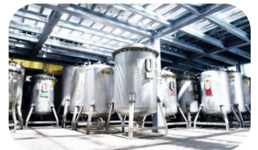
集められた再生処理待ちポッド