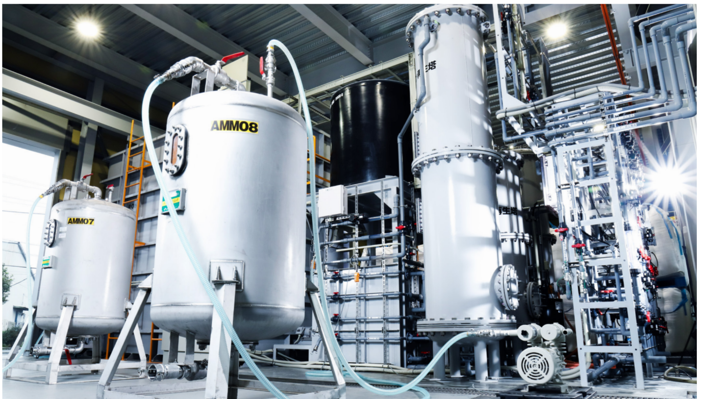
イオン樹脂再生処理 及び、再生廃液処理中のポッド (SRE-500 タイプ)